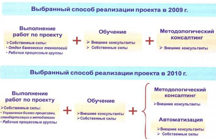
Рис. 1. Комбинированный подход, выбранный в Новикомбанке

С целью сокращения ручного труда по вводу значений показателей бизнес-процессов в Новикомбанке начата работа по автоматизации компонентов СУБП. Достичь этого позволит интеграция 4 информационных систем: ПО «Бизнес-инженер»; автоматизированная банковская система; система электронного документооборота; CRM-система (рис. 4).