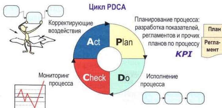
Рис. 2. Цикл Деминга